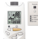
Dodatni upravljač Bežični daljinski upravljač CZ-RWSK2 + CZ-RWSC3