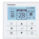
Dodatni upravljač Ožičeni daljinski upravljač CZ-R1CS