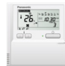
Dodatni upravljač Daljinski upravljač s brojačem vremena CZ-R1C4